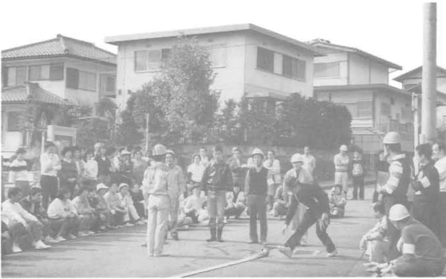
消火ホースの取扱い等の「防災訓練」は毎年2回市民清掃の日に合わせて行われます。

まちの人々が安全に暮らせるよう、防災を呼びかけたり街路燈の管理や交通事故防止対策等は、自治会の大切な役目です。(所轄・防災委員会)