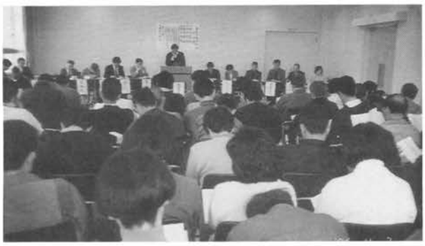
総会 年間活動報告や方針、決算・予算等は、4月初旬に開催される最高決議機関の総会で審議・承認されます。

安全で快適な生活を守り、育てるために民主的な運営が常に期待されている自治会の組織を簡単にご紹介します。