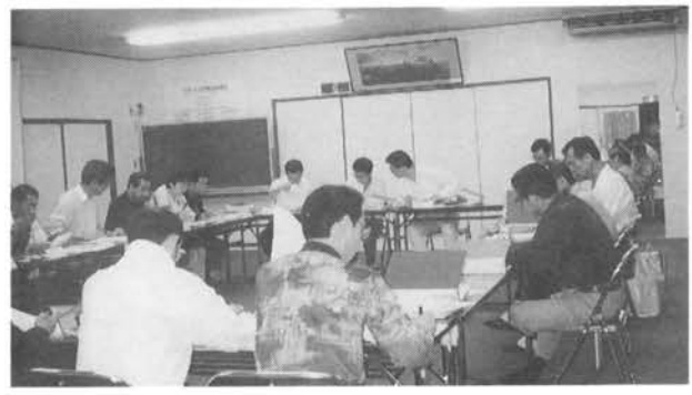
役員会 総会で決定された活動方針、その他の事業計画の決定・執行の機関です。原則として、毎月次1回開催されます。