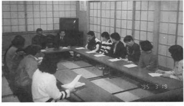
班長会議 町内の問題処理や役員会の決定事項及び行政からの通達事項等を周知するため、各町内別に毎月次1回開催されます。