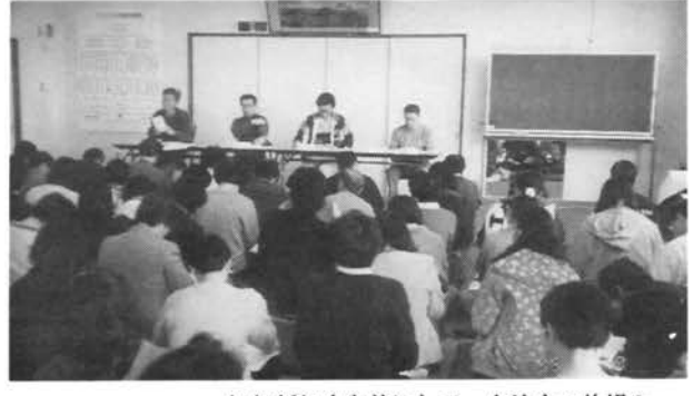
新班長説明会 毎年新年度を前にして、自治会の仕組みや活動等について、全町内の新班長や、役員内定者を対象に説明会が開かれます。