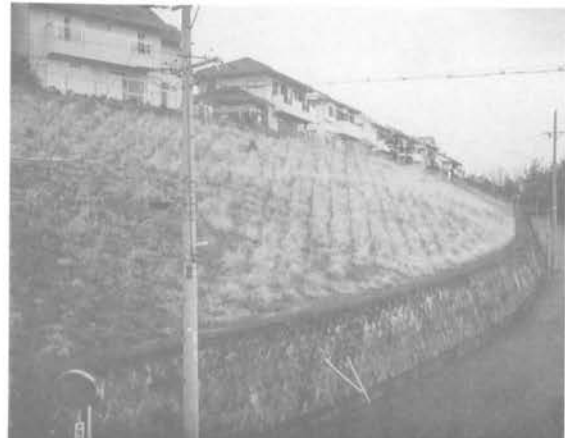
8丁目のり面 つつじが丘は大きなり面に囲まれた町。

草刈り等の管理は、現在のところ年一度に限り自治会長の要請を受けて市当局が行います。