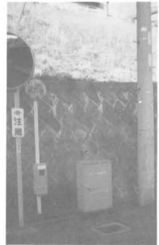
消火栓のある場所には、必ず消火ホース格納箱が設置されています。(全町内37カ所)