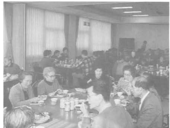
福祉委員会による、講演会のあとの食事会(ふれあいセンター)