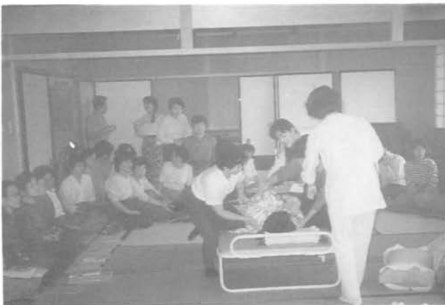
近隣ケアグループによる、介護講習会(ふれあいセンター)

お年寄りや子供たちが、安心して暮らせるまちづくりは、これからの重要課題です。自治会専門部会の福祉委員会や近隣ケアボランティアグループは、講演会、講習会、食事会、給食サービス等々住民の理解を深めるための「福祉の土壌づくり」に取り組んでおります。