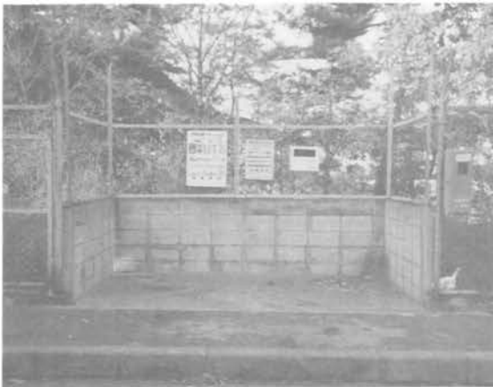
4丁目ステーション(昭和63年 3月製作)

衛生的で美しい住環境を保つため、定期的なゴミ処理や町内の清掃等も自治会の大きな努めです。(所轄・環境委員会)