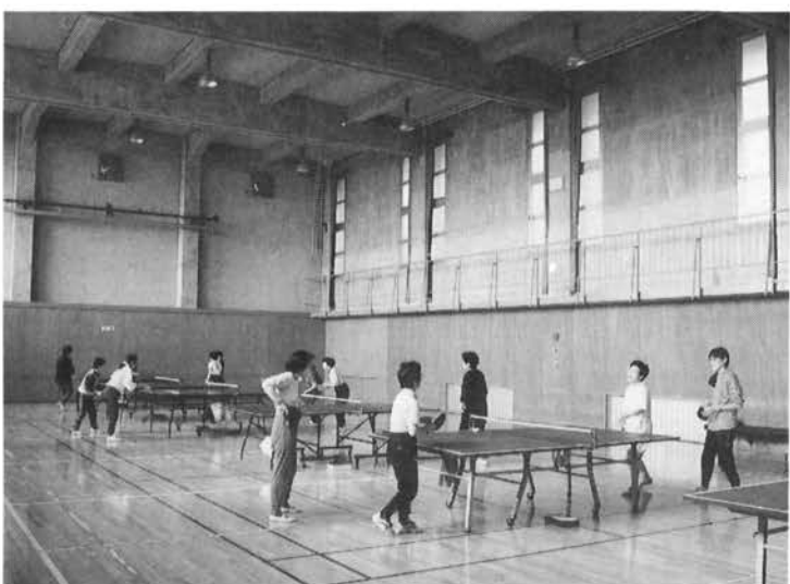
• 体育室 (バレーボール1面、バトミントン1面、卓球5台)