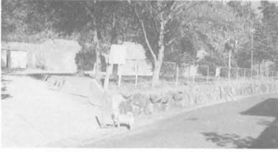
・八木山公園(1丁目)面積 1,400㎡

つつじが丘には大小7カ所の公園があります。これらの維持管理は、市都市計画部公園課との契約により「月2回以上の清掃、年2回以上の除草」を行うことによりその報償金として、年額259,000円(平成6年度現在)が支給されています。