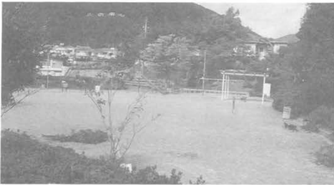
・中央公園(4丁目)面積 2,490㎡