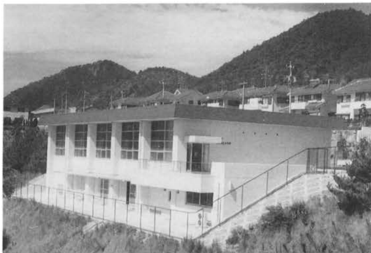
• 全 景 (敷地面積 1,318.93㎡ 建物面積 527.60㎡)

地域の人々が、卓球、バトミントン等スポーツを通してコミュニケーションを深めるための一大スペース。災害時の緊急避難場所にも指定されている市営施設。管理人は、校下連合自治会長が地元住民の中から推薦し、市教育委員会体育課より委嘱されます。