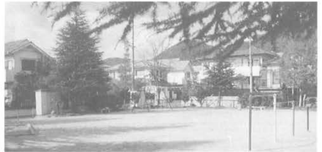
・南公園(8丁目) 公園は子供の遊び場として、また町内住民の貴重な野外ふれあいの場でもあります。