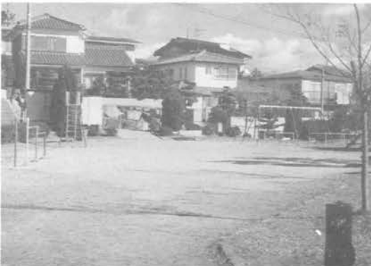
・西公園(6丁目)面積 1,310㎡