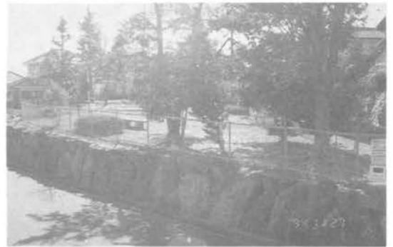
・東公園(5丁目) 石垣で船のようにつくられた、面積 770㎡ いちばん小さな公園。