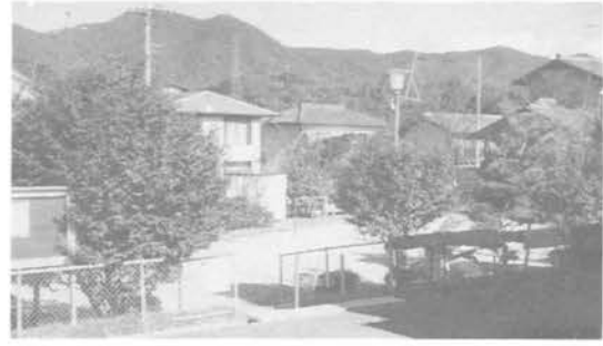
・北公園(3丁目)面積 890㎡