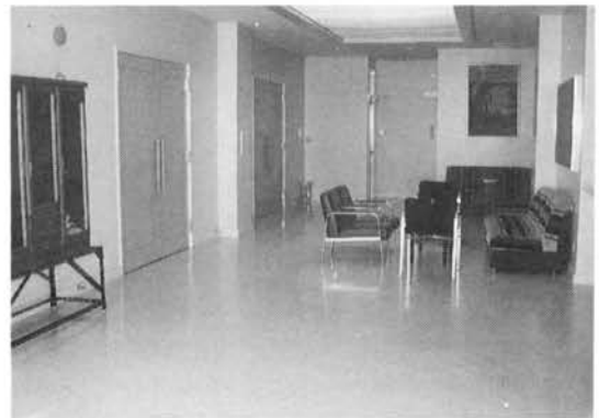
●ゆったりとした玄関ロビー

住民相互のふれあいの場として常に良好な状態に保たれ、また、周辺住民に迷惑をかけるような管理運営を図るため、自治会をはじめ寿会、婦人会、子ども会、民生委員等による管理運営委員会が自治会組織のひとつとして設けられています。