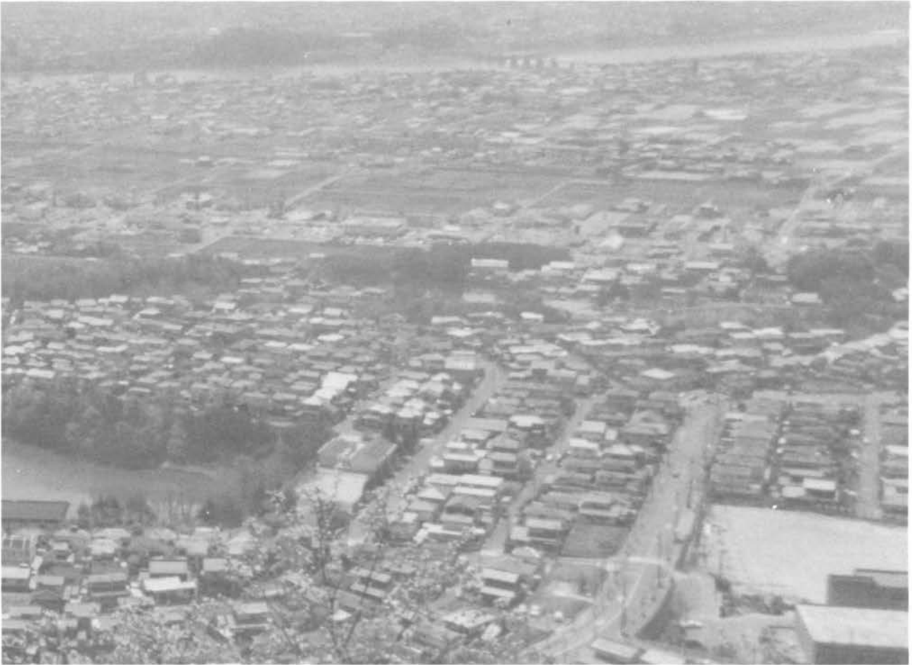
・八木山山頂より、つつじが丘を眼下に木曾川を望む。