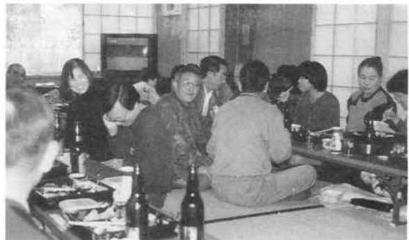
●親睦の場として和室がよい。