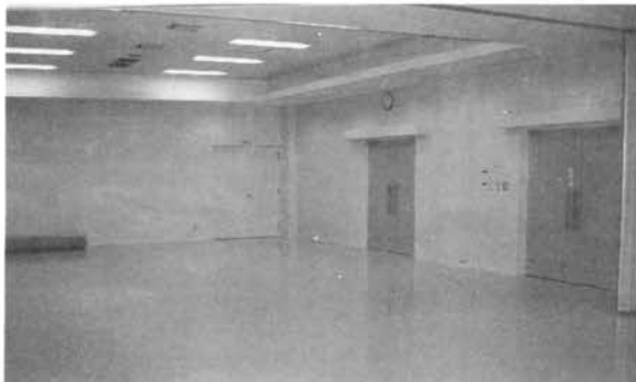
●大きな会合、講演会や葬儀等に最適な大ホール

この施設は「防衛施設周辺民生安定施設整備事業」により、市民の学習・保育・休養及び集会の用に供し、地域住民の福祉の増進をはかるために建設された施設で、災害時の緊急避難場所にも指定されています。市と防衛庁の補助金により建設され、自治会が管理を委託されたものです。