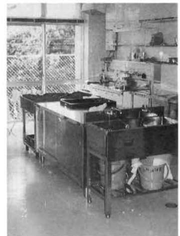
●料理教室もできる厨房